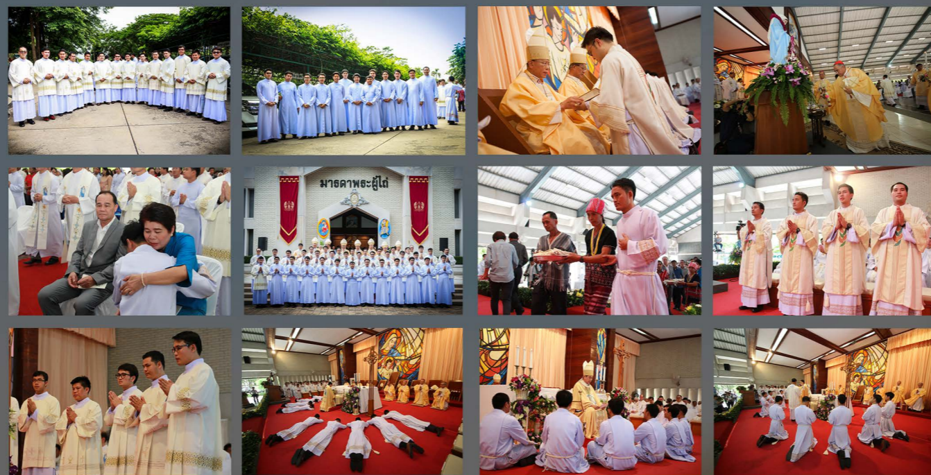
13 สิงหาคม 2559 พิธีบวชสังฆานุกรฯ

พิธีบวชขอพระคุณสมโภชพระนางมารีย์รับเกียรติเข้าสู่สวรรค์ และพิธีบวชสังฆานุกร แต่งตั้งผู้ช่วยพิธีกรรม และผู้แทนพระคัมภีร์ ณ อาคารมารดาพระผู้ไถ่ โดยในพิธีครั้งนี้มีนักศึกษาวินิตวิทยาลัยแสงธรรมรับการบวช และแต่งตั้งด้วย