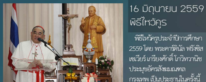
16 มิถุนายน 2559 พิธีไหว้ครู

พิธีไหว้ครูประจำปีการศึกษา 2559 โดย พระคาร์ดินัล ฟรังซิส เซเวียร์ เกรียงศักดิ์ โกวิทวาณิช ประมุขอัครสังฆมณฑล กรุงเทพฯ เป็นประธานในครั้งนี้